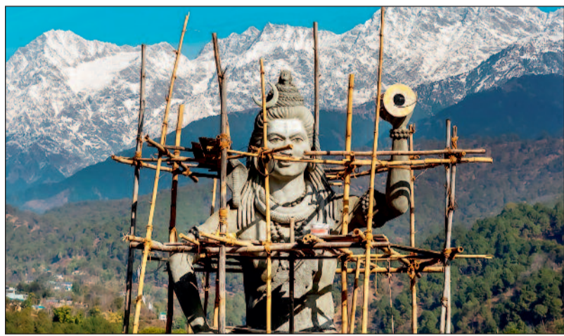
हिमाचल प्रदेश के पालमपुर में सोमवार को खिती शूष वाले में धौलाधार रंज की बर्फ से ढकी चोटी पर भगवान शिव की बन रही मूर्ति।